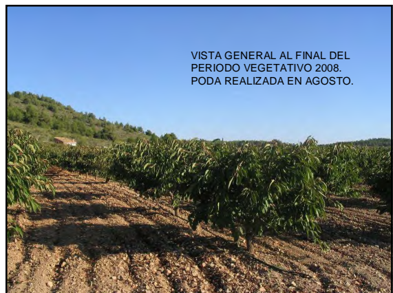
VISTA GENERAL AL FINAL DEL PERIODO VEGETATIVO 2008. PODA REALIZADA EN AGOSTO.