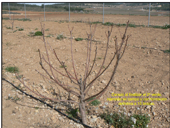
Cerezo al final de la poda verde, realizado en campo y con formación retrasada a 15 días.

Cerezo plantado a vema dormida y con formación más retrasada