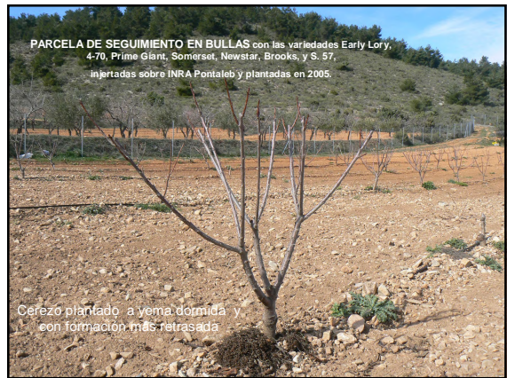
PARCELA DE SEGUIMIENTO EN BULLAS con las variedades Early Lory, 4-70, Prime Giant, Somerset, Newstar, Brooks, y S. 57, injertadas sobre INRA Pontaleb y plantadas en 2005.

Cerezo plantado a vema dormida y con formación más retrasada