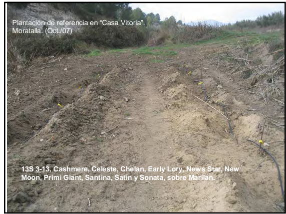
Plantación de referencia en "Casa Vitoria", Moratalla. (Oct./07)

13S 3-13, Cashmere, Celeste, Chelan, Early Lory, News Star, New Moon, Primi Giant, Santina, Satin y Sonata, sobre Marilan.