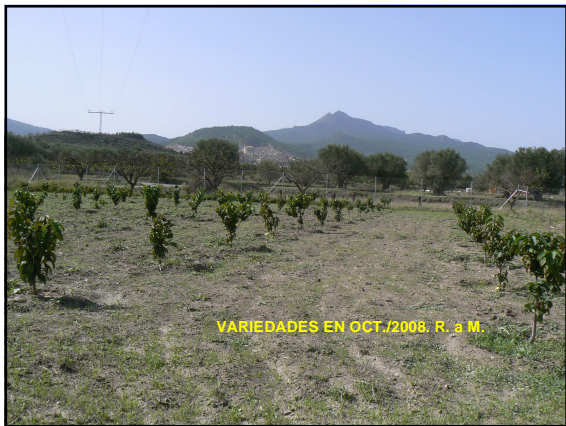
VARIETADES EN OCT./2008. R. a M.

Santina, Satin, New Moon y Lapins, sobre Marilan.