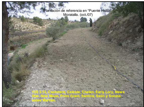
Plantación de referencia en "Puente Hellín", Moratalla. (oct./07)

13S 3-13, Cashmere, Celeste, Chelan, Early Lory, News Star, New Moon, Primi Giant, Santina, Satin y Sonata, sobre Marilan.