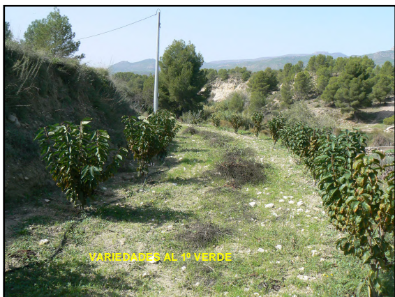
VARIETADES AL 1º VERDE

13S 3-13, Cashmere, Celeste, Chelan, Early Lory, News Star, New Moon, Primi Giant, Santina, Satin y Sonata, sobre Marilan.