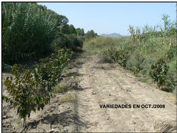
VARIETADES EN OCT./2008

13S 3-13, Cashmere, Celeste, Chelan, Early Lory, News Star, New Moon, Primi Giant, Santina, Satin y Sonata, sobre Marilan.