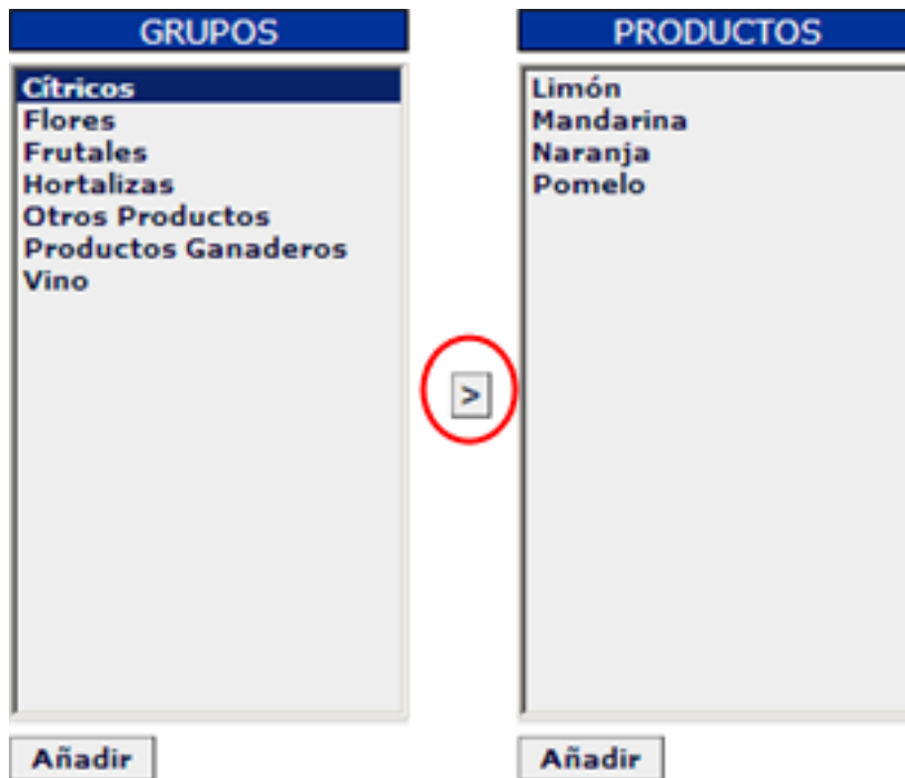
Figura 1: Desglose de Productos

Cada uno de los elementos de selección, tiene asociado un botón Añadir . Dicho botón se utiliza para grabar el criterio seleccionado, con el fin de que sea usado en el filtro, a la hora de generar el listado de precios.